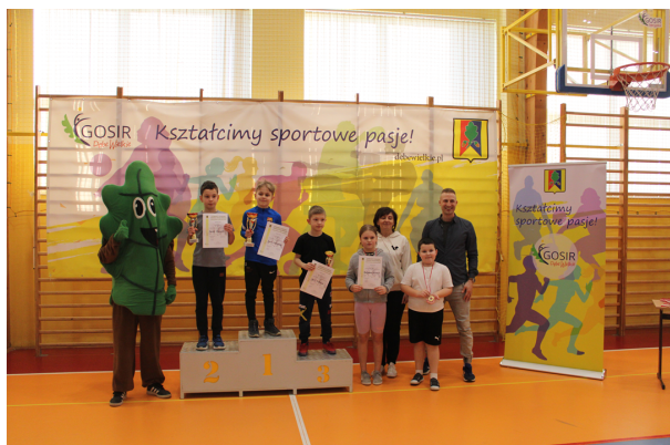
Otwarty Turniej Tenisa Stołowego

[caption id="attachment_47587" align="alignnone" width="1280"]