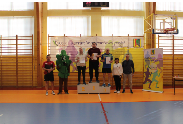
Otwarty Turniej Tenisa Stołowego