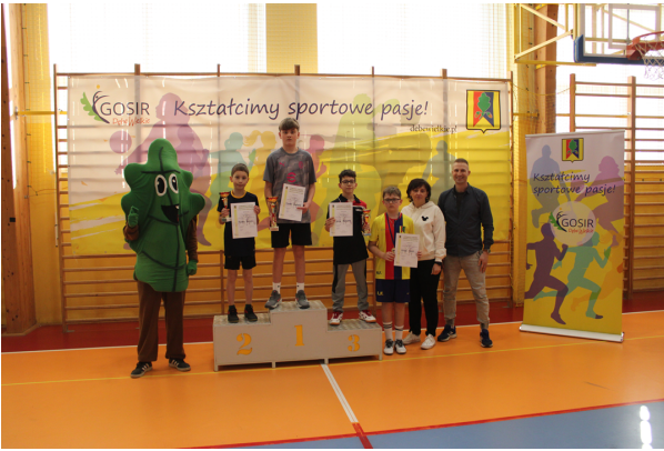
Otwarty Turniej Tenisa Stołowego