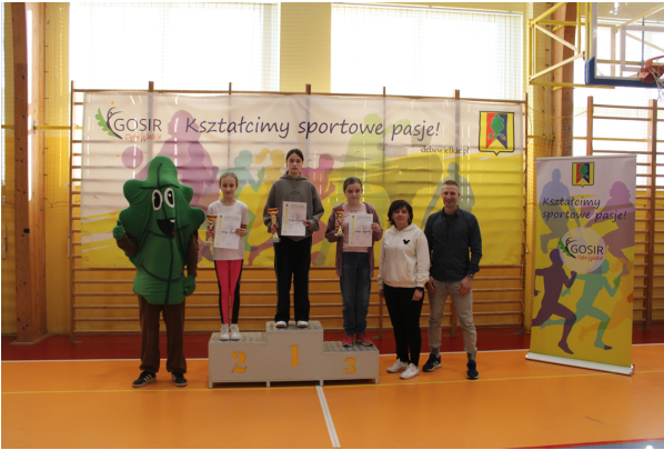
Otwarty Turniej Tenisa Stołowego