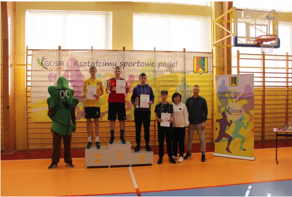
Otwarty Turniej Tenisa Stołowego