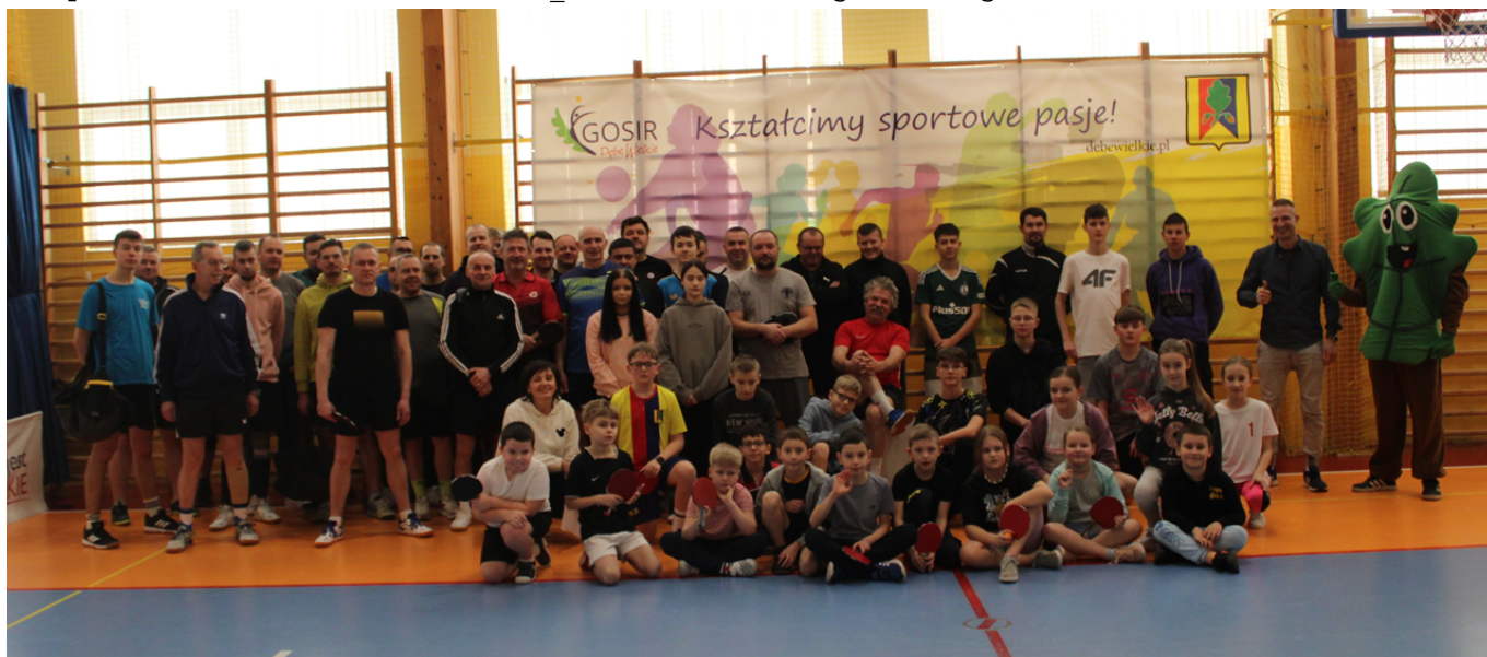
Otwarty Turniej Tenisa Stołowego[/caption]

[caption id="attachment_47587" align="alignnone" width="1280"]