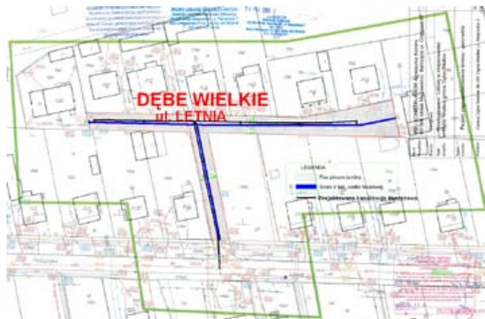
Mapka poglądowa przebudowy ciągu pieszo-jezdnego w ul. Letniej w m. Dębe Wielkie