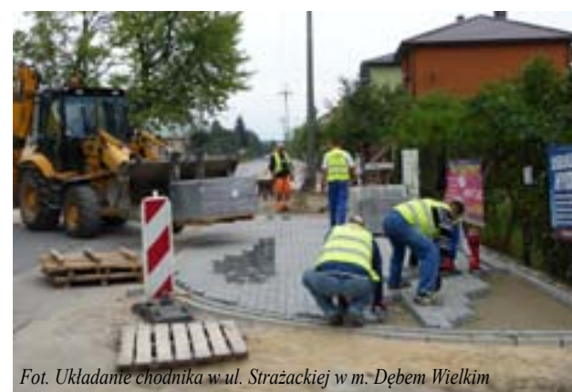
Fot. Układanie chodnika w ul. Strażackiej w m. Dębem Wielkim