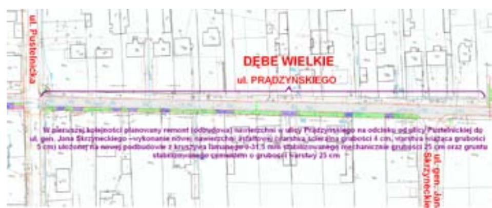
Mapka poglądowa remontu (odtworzenia) odcinka ul. Prądzyńskiego w m. Dębe Wielkie

cementem o grubości warstwy 25 cm. Założono powierzchniowe odwodnienie dróg systemem spadków podłużnych i poprzecznych do nowoprojektowanych wpustów kanalizacji deszczowej. Wpusty zostaną zlokalizowane w ścieku z betonowej kostki brukowej grubości 6 cm zlokalizowanym w osi ciągów pieszo-jezdnym. Dokumentacja dla w/w dróg zostały przez Wójta Gminy Dębe Wielkie złożone do Starostwa Powiatowego w Mińsku Mazowieckim i na ich podstawie Starosta Miński wydał: W dniu 16 czerwca 2014 roku decyzję pozwolenia na przebudowę i przebudowę ciągu pieszo-jezdnego ul. Letniej oraz budowy w niniejszej ulicy sieci kanalizacji deszczowej. W dniu 23 czerwca 2014 roku decyzję pozwolenia na rozbudowę i przebudowę ciągu pieszo-jezdnego ul. Krótkiej oraz budowy w niniejszej ulicy sieci kanalizacji deszczowej.