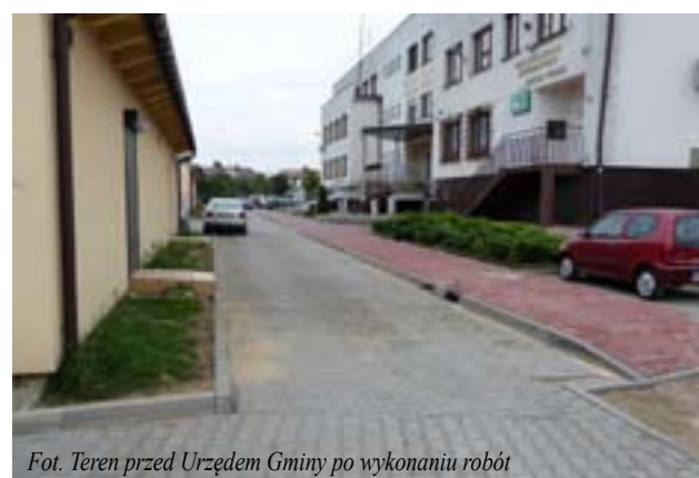
Fot. Teren przed Urzędem Gminy po wykonaniu robót