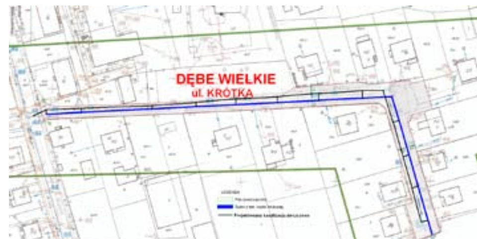
Mapka poglądowa rozbudowy i przebudowy ciągu pieszo-jezdnego w ul. Krótkiej w m. Dębe Wielkie