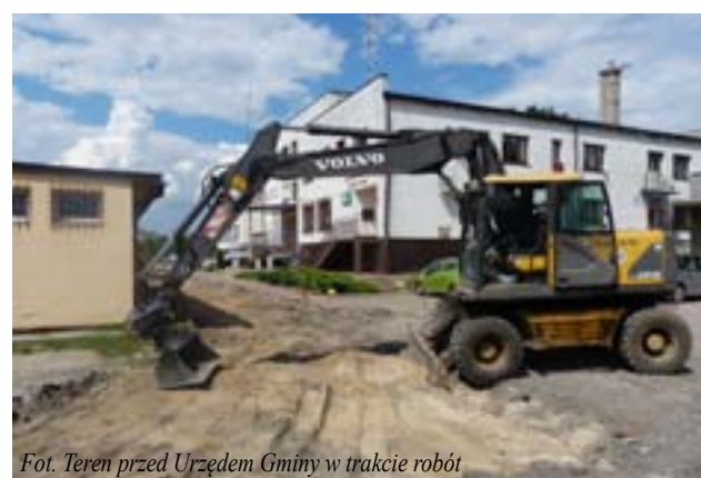
Fot. Teren przed Urzędem Gminy w trakcie robót