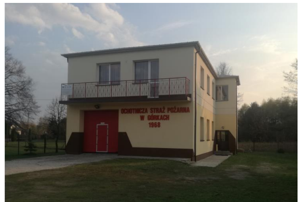
Fot.3 Budynek strażnicy po remoncie.

W roku 2014 nasza jednostka złożyła wniosek o środki unijne na „Termomodernizację budynku OSP Górk”. Wniosek został rozpatrzony pozytywnie i otrzymaliśmy pomoc w kwocie 50.000 zł. Realizacja zadania wymagała od druhów ofiarowania ogromnej ilości czasu, który poświęcają jako wkład własny w prace remontowe. Ciężka praca druhów przynosi widoczny efekt, rok później zostaje oddany do użytku ocieplony i wyremontowany budynek strażnicy.