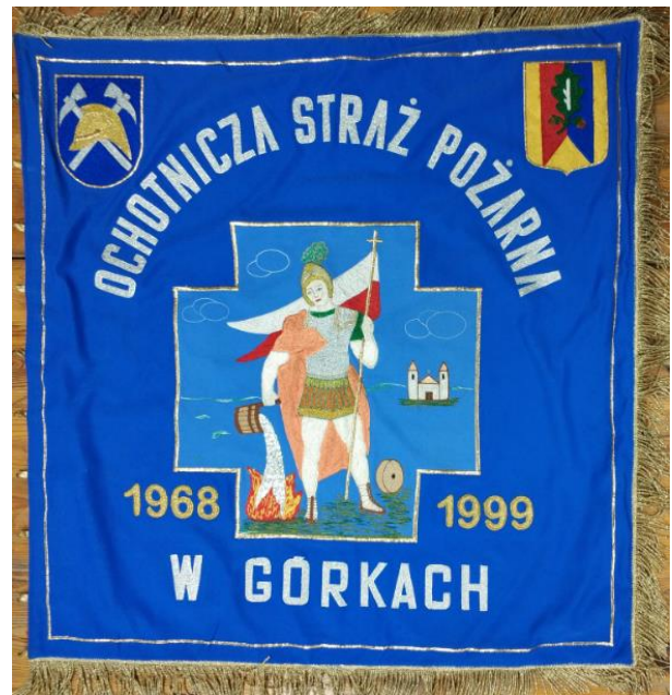
Fot. 4 Sztandar ufundowany z okazji 30-lecia OSP

Termin obchodów rocznicy ustalono na dzień 9 maja 1999 roku. Jubileusz 30-lecia Ochotnicza Straż Pożarna w Górkach świętowała z własnym wozem i sztandarem, któremu nadano Brązowy Medal za Zasługi dla Pożarnictwa.