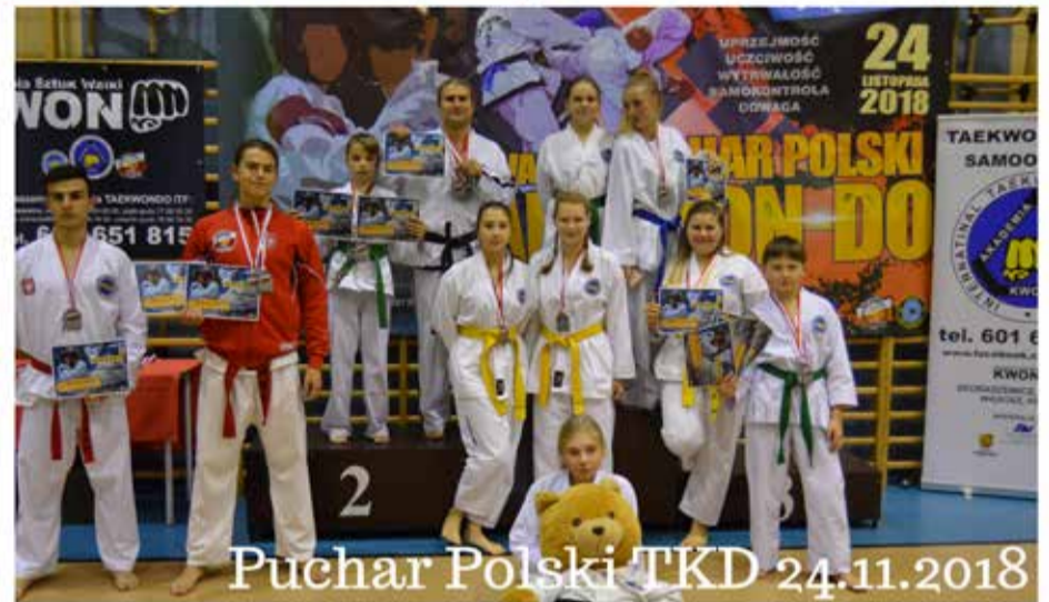
Puchar Polski TKD 24.11.2018