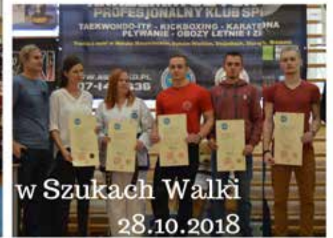
w Szukach Walki 28.10.2018